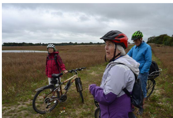
Udsigt til Troldebakkerne.